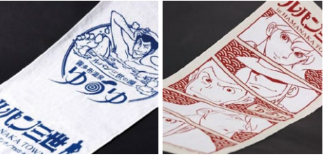
▲フェイスタオル ▲てぬぐい