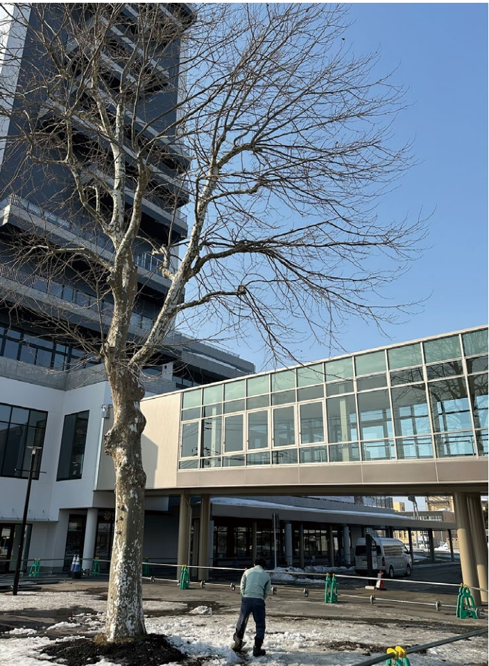
▲開業間近の北広島駅西口の商業複合ビル

地元の北広島ゆかりの店がないのも気にかかる。出店を検討していた飲食店主からは「出店料が予想以上に高かった。また3年後に球場に直結するJR新駅ができたときに、どのくらい店を利用してくれるか計算できない」などと、将来を不安視して出店を控えたという声もあった。