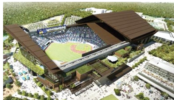
▲「Fビレッジ1番」にある「エスコンフィールド HOKKAIDO」

札幌から新千歳空港 行きの快速エアポート に乗って18分。540 円の切符を買うといか にも「遠い」というイ メージがあるものの、 これまで札幌ドームま で行くには札幌駅から 地下鉄を乗り継いで福 住駅まで行き、10分以 上も歩かされてやっと ドーム入口にたどり着 いていたことを考える